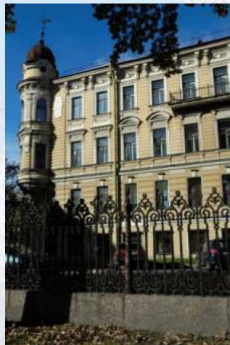
В. О. 2-ая линия, д. 1 Окрашено в 2005 году. Срок эксплуатации 11 лет.