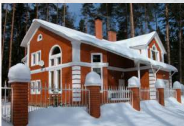
Дом в коттеджном поселке Valkesaari Окрашено в 2005 году. Срок эксплуатации 11 лет