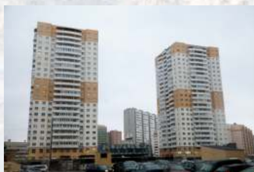
Комплекс в Шушарах Окрашено в 2006 году. Срок эксплуатации 10 лет. технология «мокрый фасад»