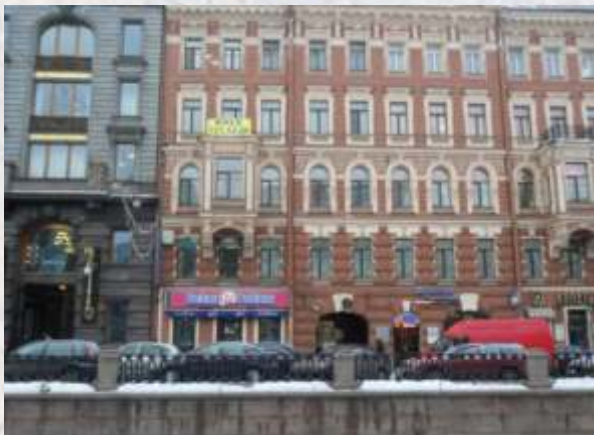
Конюшенная ул. д. 14 Окрашено в 2008 году. Срок эксплуатации 8 лет.